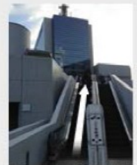
デッキをさらに上がる