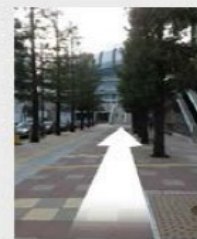
歩道でドームを目指す

ドームに向かう歩道よりドーム外周デッキへ上がり、直結するドームシティガスビル4F受付へお越しください。