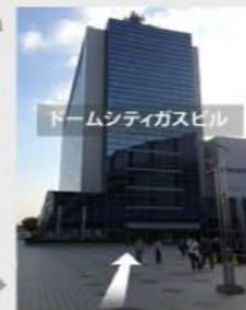
ドームシティガスビル 受付へ