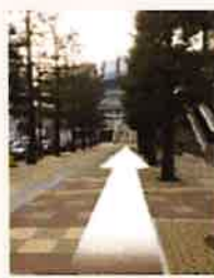
歩道でドームを目指す

ドームに向かう歩道よりドーム外周デッキへ上がり、直結するドームシティガスビル4F受付へお越しください。