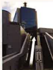
デッキをさらに上がる