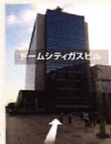
ドームシティガスビル 受付へ