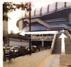
ドーム外周デッキに上がり 左側ドームシティガスビルへ