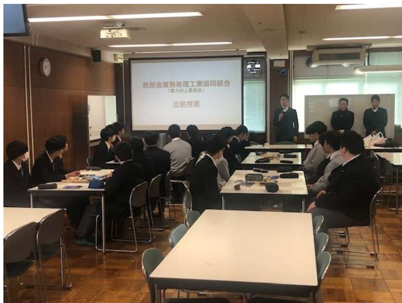
大阪府立布施工科高等学校での出前講座出張授業の様子

令和8年1月30日(木)、大阪府立布施工科高等学校において、熱処理技術の魅力伝える出前講座出張授業を実施しました。参加生徒数は2年生42名でした。現役高校生の考えに直接触れることのできる貴重な機会となりました。