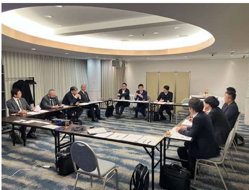
道頓堀ホテルでの令和 7 年度第 3 回魅力向上委員会の様子

令和 8 年 3 月 17 日(火)、道頓堀ホテルにおいて、第 3 回魅力向上委員会を開催しました。出席者は 12 名で、前回委員会以降の活動報告、ならびに日本金属熱処理工業会ビジョン検討委員会の報告のほか、活発な情報交換が行われました。