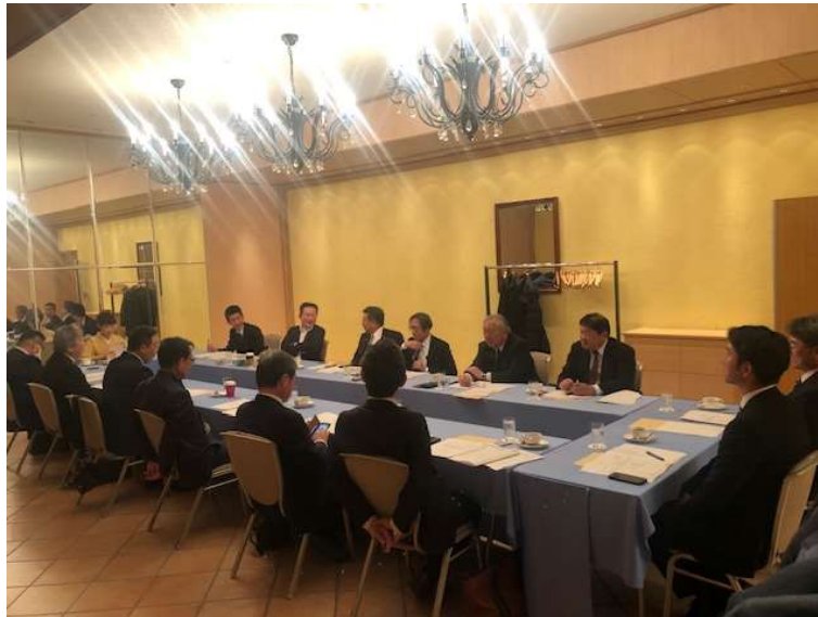
シティプラザ大阪での令和7年度第5回理事会の様子