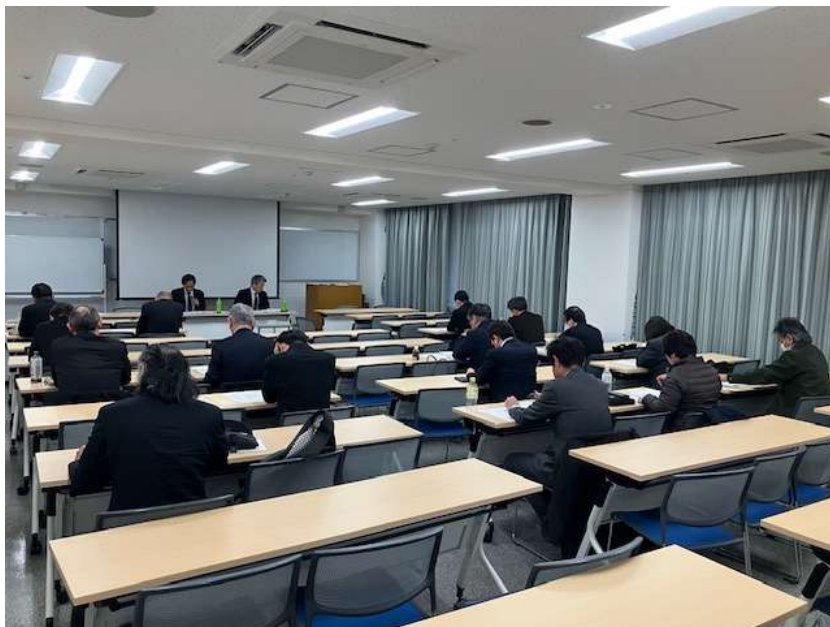
大阪科学技術センターでの第3回技術委員会の様子

令和8年3月11日(水)、大阪科学技術センター4階404号室において、第3回技術委員会を開催しました。出席者は19名で、理化学研究所の関係者をゲストに迎え、AI活用に関する意見交換を行うとともに、直近に開催された日本金属熱処理工業会技術委員会の報告や、来年度の事業計画等についての活発な意見交換が行われました。