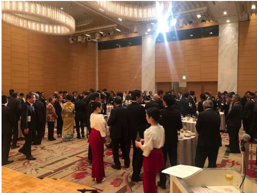
令和 8 年新年懇親交流会の会場内の様子