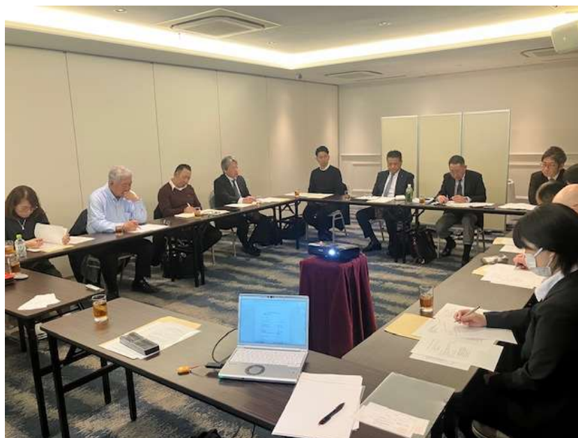
道頓堀ホテルでの令和7年度第3回総務委員会の様子

令和8年3月24日(火)、道頓堀ホテルにおいて、第3回総務委員会を開催しました。出席者は13名で、賃上げ状況の調査結果が報告されるとともに、活発な情報交換が行われました。また、次年度の事業計画について意見交換が行われました。