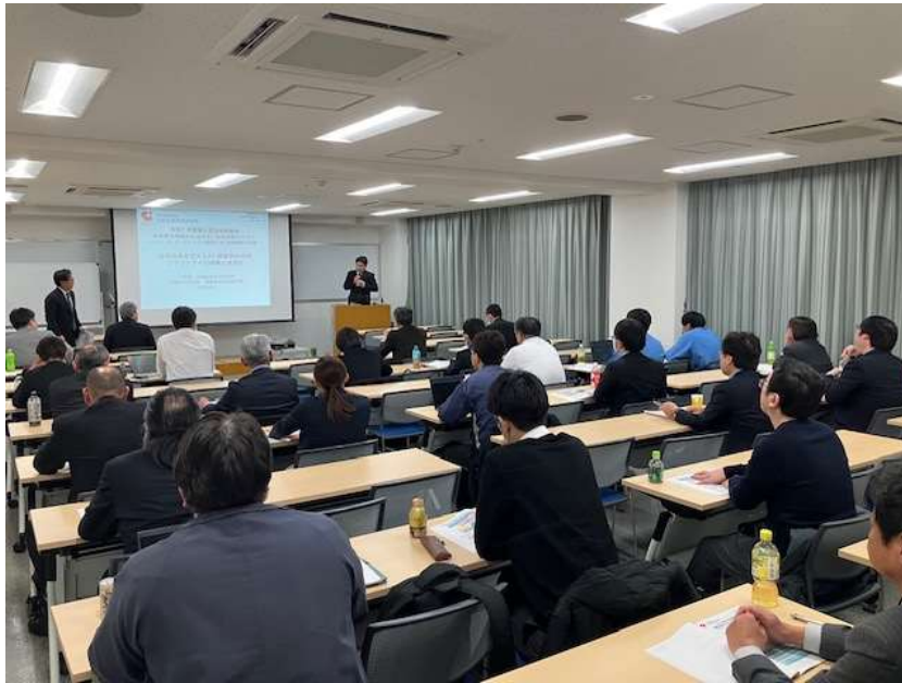
大阪科学技術センターでの令和7年度第2回技術講習会の様子