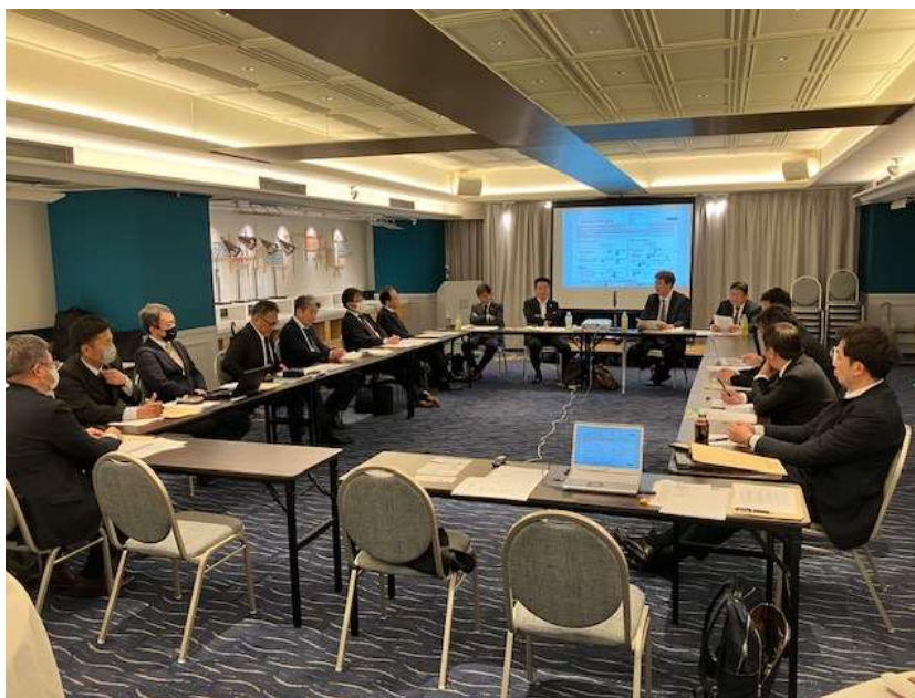
道頓堀ホテルでの第3回マーケティング委員会の様子

令和8年2月25日(水)、道頓堀ホテルにおいて、第3回マーケティング委員会を開催しました。出席者は16名で、日本金属熱処理工業会マーケティング委員会報告、直近の活動報告の後、活発な情報交換、意見交換が行われました。