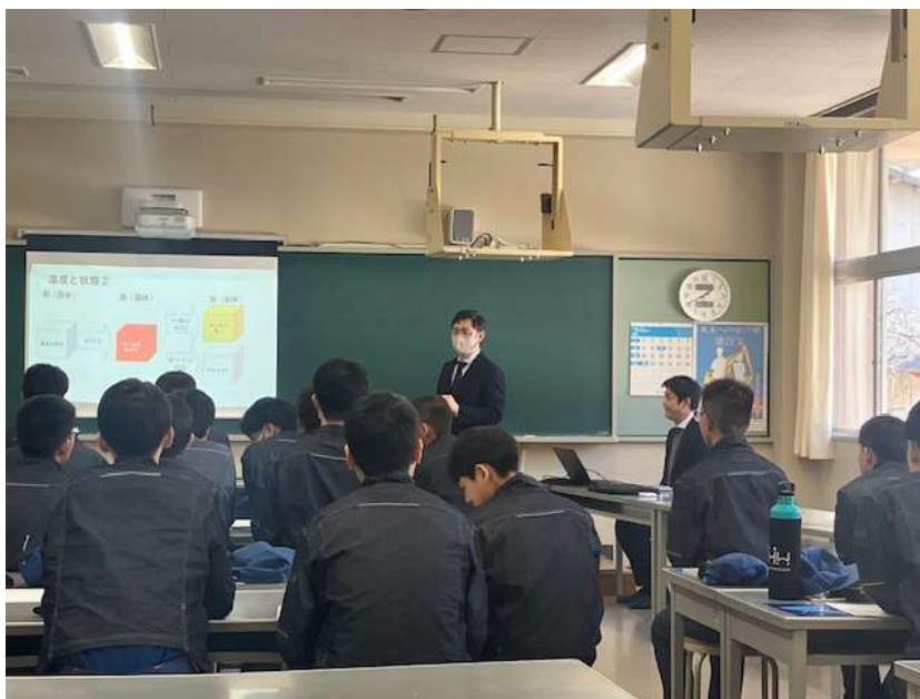
山口県立岩国工業高等学校での出前講座出張授業の様子

令和 8 年 2 月 18 日(水)、山口県立岩国工業高等学校において、熱処理技術の魅力伝える出前講座出張授業を実施しました。昨年に引き続き 2 回目の実施となり、参加生徒数は 35 名でした。講義終了後、質疑応答を 50 分間行い、現役高校生の考えに直接触れることのできる貴重な機会となりました。